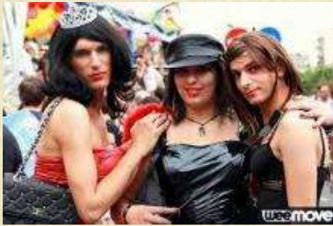
Marche des fiertés

D'autres exemples : Le Zapatisme, la protection des réfugiés, les Mouvements LGBTQIA+ etc.